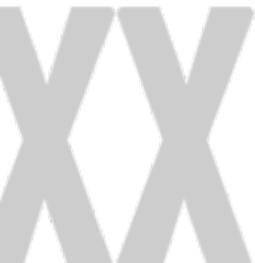
foto pagina 1 : De Schaapjesfabriek | Tessa Veldhorst ontwerp pagina 3: Oak-Studio | Marcel van den Broek